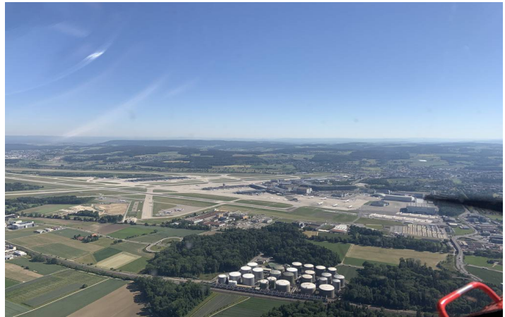
Turning Downwind RWY28