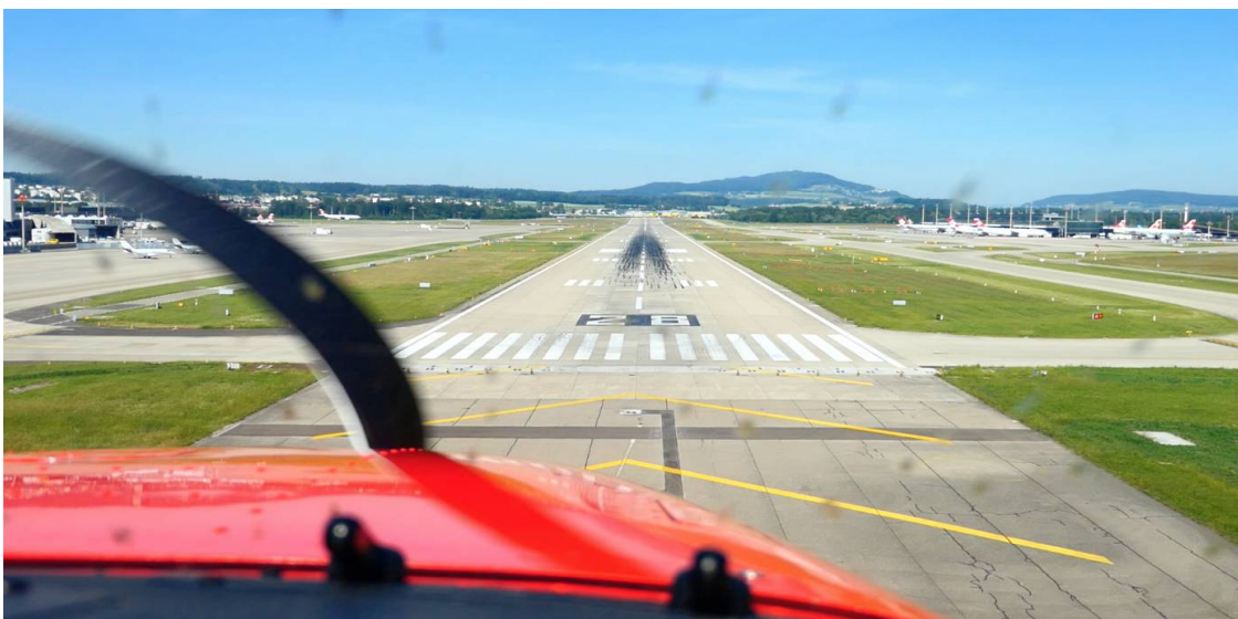
Atterissage à Zurich

Nous nous sommes sentis comme des VIP's (Very Important Pilots 😊). Lors de la première prise de contact avec Zurich Tour, le contrôleur nous a demandé si nous souhaitions rouler directement vers le Dock E ou d'abord vers le GAC. Comme il y avait très peu de trafic aérien, il nous a donné l'autorisation d'atterrir alors que nous étions encore en vent arrière. Cela nous a permis de profiter pleinement de l'approche impressionnante en piste 28.