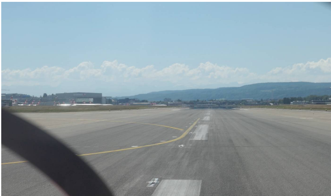
Cleared for takeoff Runway 16

Enrichis d'impressions fortes et de belles images, nous avons repris le chemin de retour peu avant midi. Nous avons été étonnés au moment de recevoir la « taxi clearance » : lorsque j'ai demandé sur quelle piste nous décollerions, on nous a accordé à notre plus grand bonheur un départ d'intersection sur la piste 16. Quel honneur ! En effet, cette piste est normalement réservée à midi pour les longs courriers.